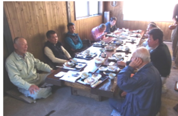
フィールドワーク後の意見交換